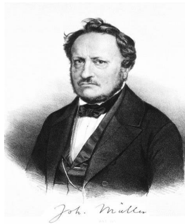
Legenda da Imagem: Johannes Müller, pai da psicologia experimental.

Com estes resultados, Ebbinghaus inferiu que as associações se criavam de um modo automático e mecânico, isto é, sem que houvesse qualquer intervenção do participante, mostrando que este apresentava um papel passivo na metodologia da investigação.