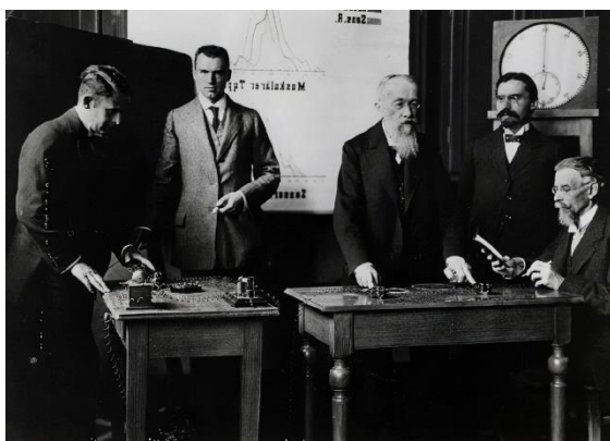
Legenda da Imagem: Wundt e a psicologia como ciência

De facto, foi Wundt que orientou uma geração de psicólogos experimentais, que após desenvolverem as suas teses em Leipzig, fundaram novos laboratórios de psicologia no país da sua nacionalidade.