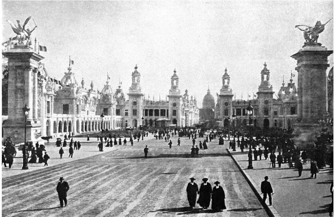
Legenda da Imagem: Exposição Universal de Paris (1900) - Uma viagem no tempo através de fotos de época

Algumas das principais atrações foram a atuação da banda do luso-americano de John Philip Sousa, a qual percorreu as principais avenidas da cidade, incluindo a Champs-Élysées. Contudo, o que mais aclamou elogios foi a relevância que deram à Eletricidade. E para provar a dimensão da eletricidade, no seu discurso de abertura, o presidente Loubet, afirmou que esta exposição seria o início de um século XX com mais fraternidade onde o encontro entre vários governos seria sereno.