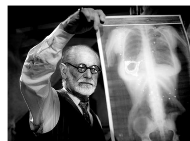
Legenda da Imagem: Wundt como psicólogo.

No entanto, estas adversidades são significativas, pois a psicologia só tem atingido grandes avanços graças a estes factos.