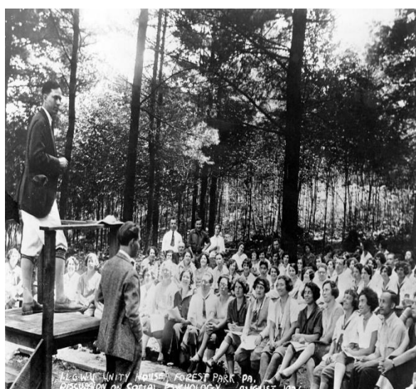
Legenda da Imagem: Leitura de uma experiência sobre psicologia social