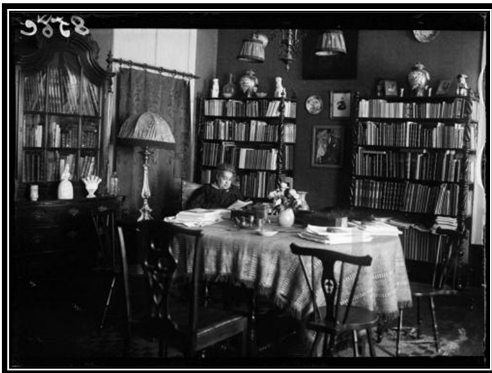
Biblioteca pessoal de Ana de Castro Osório.

A escritora é grande defensora da igualdade dos direitos para homens e mulheres, transmitindo essas mesmas ideias nas suas obras literárias. Guiada pelas notícias que chegam de fora, Ana de Castro Osório quer trazer para o seu país a igualdade de direito ao voto, à educação, às oportunidades de trabalho e igualdade salarial, dando assim grande importância à independência económica da mulher. Num país dominado pelo analfabetismo, torna-se também pioneira da literatura infantil. A escritora, para além da edição de manuais escolares e textos didáticos, traz também para a literatura portuguesa contos infantis, não só da sua autoria, mas também traduções de obras de outros autores igualmente dedicadas às crianças. Obras estas publicadas em fascículos ou em livros, que pretende tornar cada vez mais apelativas, este trabalho pode-se revelar verdadeiramente importante no combate ao analfabetismo e a escritora transforma-se então numa figura ímpar na cultura em Portugal.